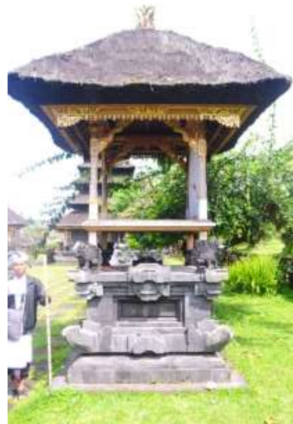
Gambar 4. Hasil Pengambilan Gambar/Foto Tampak Samping Kelompok 3 Bangunan 1