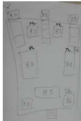
Gambar 7. File Mentah Hasil Pengambilan Gambar