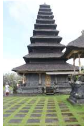
Gambar 9. Hasil Pengambilan Gambar/Foto Tampak Depan Kelompok 3 Bangunan 4