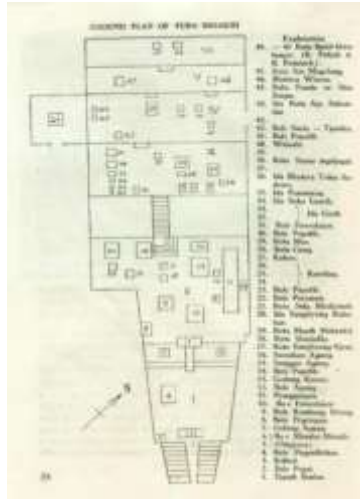
Gambar 1. Skema Dasar/Denah Pura Besakih