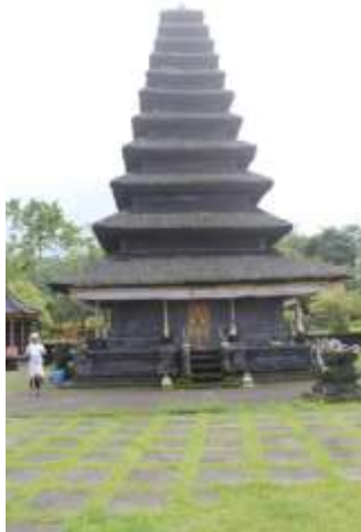
Gambar 8. Hasil Pengambilan Gambar/Foto Tampak Depan Kelompok 3 Bangunan 4