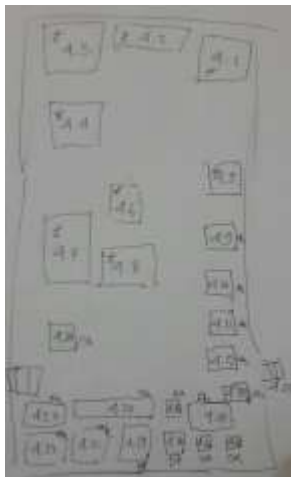
Gambar 6. File Mentah Hasil Pengambilan Gambar

Hasil dari penelitian ini adalah berupa foto/gambar tampak depan samping daripada Pura Besakih bagian Penataran Agung. Total bangunan yang terdokumentasikan adalah sebanyak 49 buah bangunan yang terdiri dari pelinggih dan bangunan lainnya. Dari 49 bangunan tersebut total terdapat 458 foto/gambar tampak depan, samping dan belakang yang terkumpul. Pada Gambar 6 dan 7 merupakan denah yang dibuat pada tahap awal. Selanjutnya pada tahap pengerjaan, dilakukan pengambilan foto/gambar tampak seluruh bangunan yang ada pada Penataran Agung Pura Besakih, salah satu hasil dapat dilihat pada Gambar 8 dan 9.