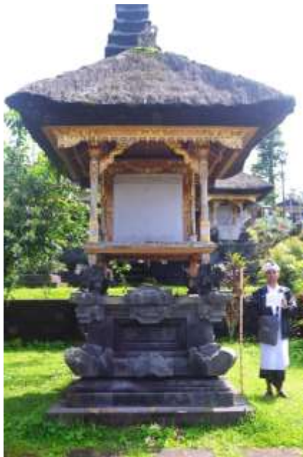
Gambar 3. Hasil Pengambilan Gambar/Foto Tampak Depan Kelompok 3 Bangunan 1

Berdasarkan hasil tahap pertama yang berupa pemetaan dan pengelompokan Penataran Agung, akan dilakukan pengambilan gambar secara berurutan sesuai dengan penomoran yang telah diberikan pada denah. Pada Gambar 3 terlihat salah satu bangunan dengan pengambilan gambar tampak depan, selain itu terdapat satu orang yang berdiri dengan membawa tongkat dan selembar kertas. Jika diperhatikan dengan seksama tongkat tersebut terdapat garis dengan dua tipe warna yaitu merah dan biru. Garis merah berukuran 10cm sedangkan garis yang berwarna biru menandakan 50 cm. Tongkat tersebut digunakan sebagai acuan untuk menentukan ukuran daripada bangunan. Sedangkan kertas yang dibawa terdapat angka 3.1, yang mana artinya adalah bangunan tersebut merupakan kelompok tiga dan bangunan nomor satu.